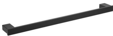
AI1413B Acabado negro