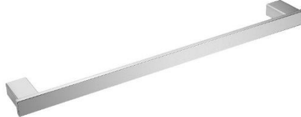
AI1413C Acabado brillante