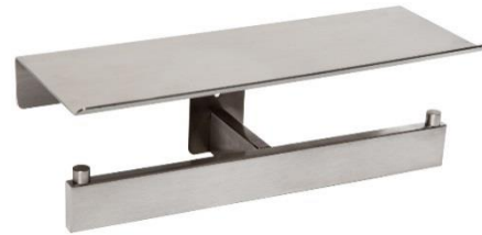
AI2006CS Acabado satinado