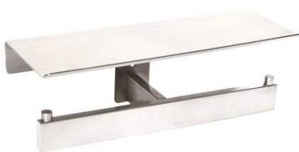
AI2006C Acabado brillante