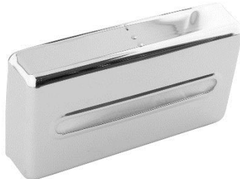
AC0083C Acabado brillante