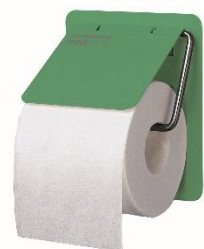
AI0130CS Acabado RAL