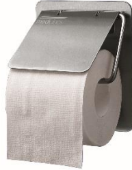
AI0130CS Acabado satinado