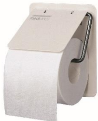
AI0130 Acabado blanco