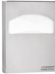
DCA100CS acabado satinado