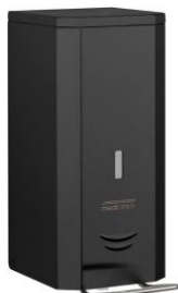
DJFP035B Acabado negro mate