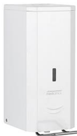
DJFP035 Acabado blanco