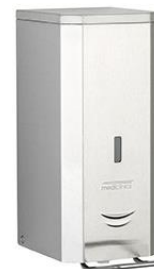
DJFP035CS Acabado satinado