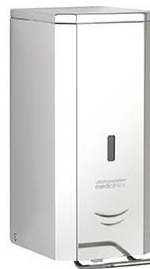
DJFP035C Acabado brillante