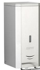
DJP0034CS Acabado satinado