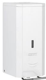
DJSP036 Acabado blanco