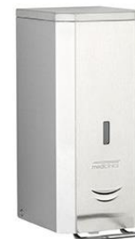
DJSP036CS Acabado satinado