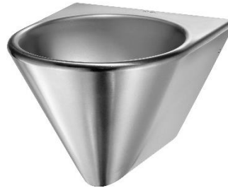
SNLM56CS Acabado satinado