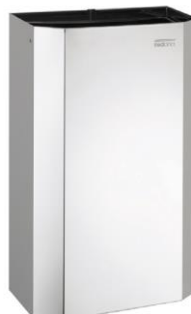
PPA4279C Acabado brillante