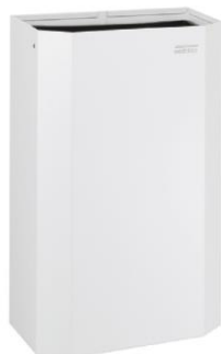
PPA4279 Acabado blanco