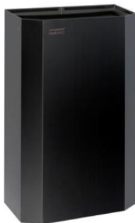
PPA4279B Acabado negro mate