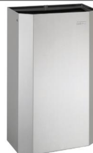
PPA4279CS Acabado satinado