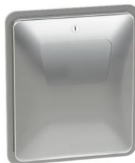
4A00 – 4A00-10 acabado satinado