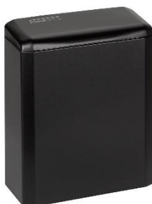
PP0006B Acabado negro mate