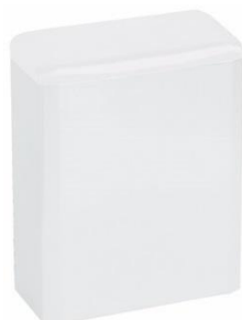
PP0006 Acabado blanco