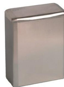
PP0006CS Acabado satinado