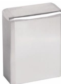
PP0006C Acabado brillante