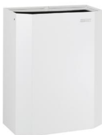
PPA2279 Acabado blanco