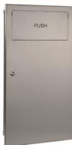
PPE0010CS Acabado satinado