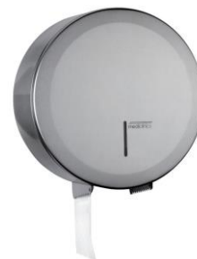
PR2783CS Acabado satinado