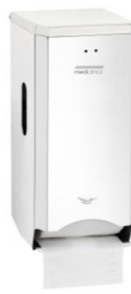
PR2784C Acabado brillante