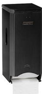
PR2784B Acabado Epoxy negro