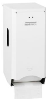
PR2784 Acabado Epoxy blanco