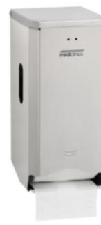
PR2784CS Acabado satinado