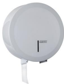
PR2787 Acabado blanco