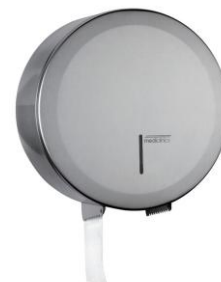
PR2787CS Acabado satinado