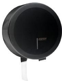
PR2787B Acabado negro