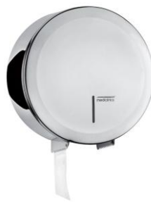
PR2787C Acabado brillante