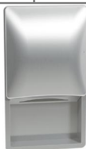
2A02 - 2A02-11 acabado satinado