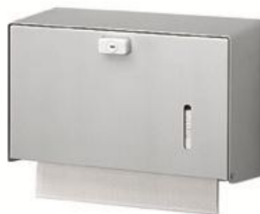
DT0600 Acabado satinado