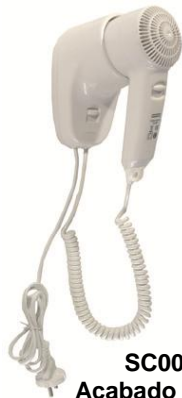
SC0010 Acabado blanco