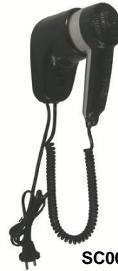
SC0010CS Acabado negro