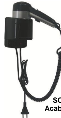
SC0020CS Acabado negro