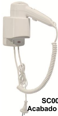
SC0020 Acabado blanco