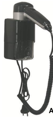
SC0030CS Acabado negro