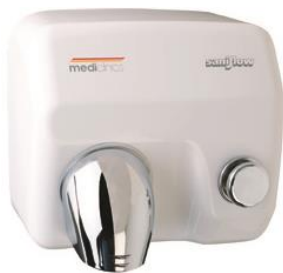
E05 Acabado blanco