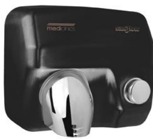
E05B Acabado negro mate