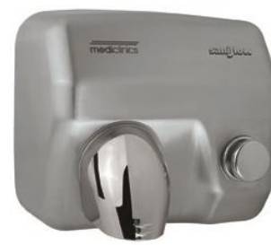
E05CS Acabado satinado