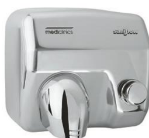
E05C Acabado brillante