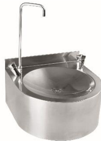
FAM120CS Acabado satinado