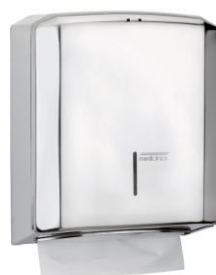
DT2106C Acabado brillante