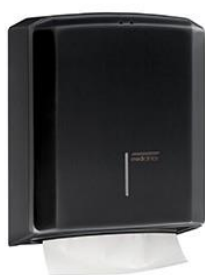
DT2106B Acabado Epoxy negro