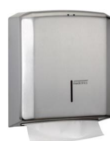
DT2106CS Acabado satinado