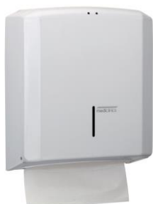
DT2106 Acabado Epoxy blanco